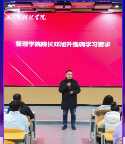
“跨境电商课程管理与考核方案”“跨境电商线上网课班级管理细则”