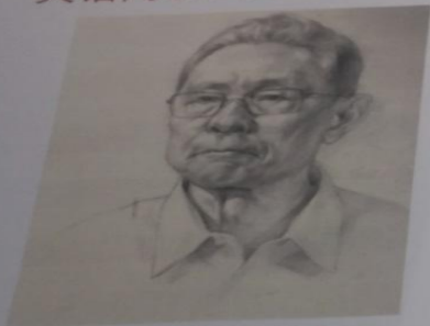
习近平主席寄语青年语录