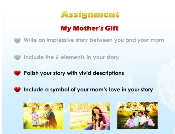
图六：Assignment (the 2 nd edition)