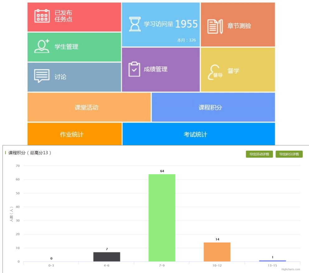
图七：学习通量化评价