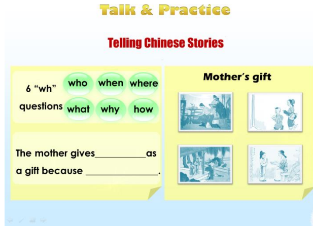
图一： Telling Chinese Stories

(2) 文本初步阅读(Read & Taste): 完成阅读工作单 Story Map 1 (Group work)